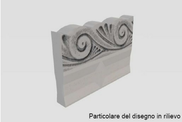
Particolare del disegno in rilievo

La sezione Cordoli Speciali include cordoli particolari quali il tipo Anas e cordoli per impieghi specifici quali piste ciclabili, giardini ed altro ancora.